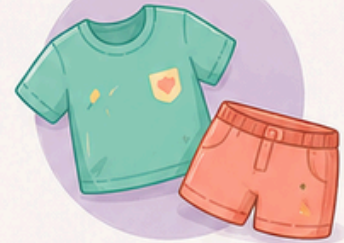
ROPA DE CAMBIO COMPLETA (camiseta, pantalón, ropa interior y calcetines).