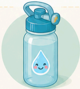
BOTELLA DE AGUA (preferiblemente fácil de abrir).

➤ Cada niño o niña deberá traer diariamente: ➤