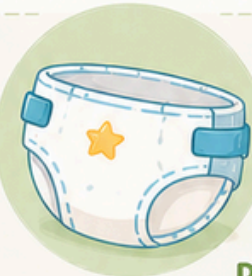
PAÑALES Y TOALLITAS

En caso de uso de pañal: mínimo 3 pañales diarios y paquete de toallitas.