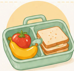
ALMUERZO SALUDABLE (fruta, bocadillo, etc.).